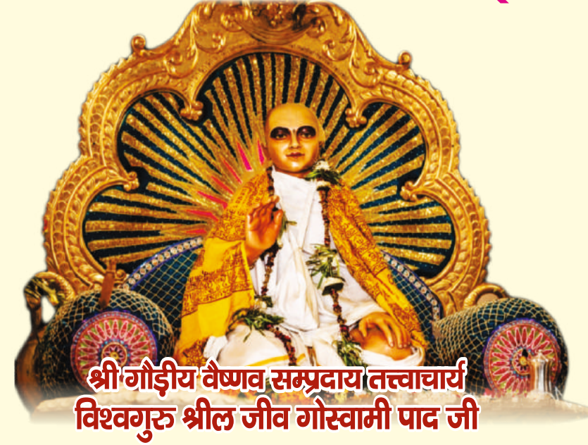
श्री गौड़ीय वैष्णव सम्प्रदाय तत्त्वाचार्य विश्वगुरु श्रील जीव गोस्वामी पाद जी

एते चांशकलाः पुंसः कृष्णस्तु भगवान् स्वयम् । इन्द्रारिव्याकुलं लोकं मृडयन्ति युगे युगे ॥